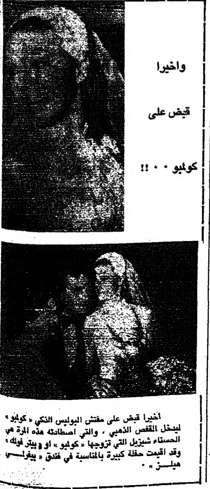
اخيرا قبض على مفتش البوليس النكي « كوكيو » ليخجل القمص الذهبي ، والتي اصطلحته هذه المرة هي الصنساء شيزيل التي تزوجها « كوكيو » او « بيتر فوكه » وقد اقيمت حفلة كبيرة بالمناسبة في فندق « بيفرلي هيلس » .

مذكرات زوجة الموسيقار ظهر مؤخرآ ، في الاسواق اليا ريسية ، كتاب بعنوان : « مذكرات كوزيما فاغتر . . . » والكتاب يحمل اسم المؤلف كوزيما زوجة الموسيقار الالاني والراحل « ريشارد فاغتر » . وتستعرض الكاتبة خلالها العبقورية الفذة ، التي كانت فيها زوجها فاغتر ، في عالم الموسيقى . . . كما تظهر بعض الاشعار التي استمدتها فاغتر من الاساطير الالمانية القديمة ، والتي ربط بينها وبين الموسيقى والرقص . كما اشارت كوزيما الى اهم اعمال فاغتر الموسيقية وينتسب ان اويرا بارسيغال وقريستانا وايزولد كانت من اعظم هذه الاعمال حيث تميزن بالرمزية والبعيد عن التقليد .